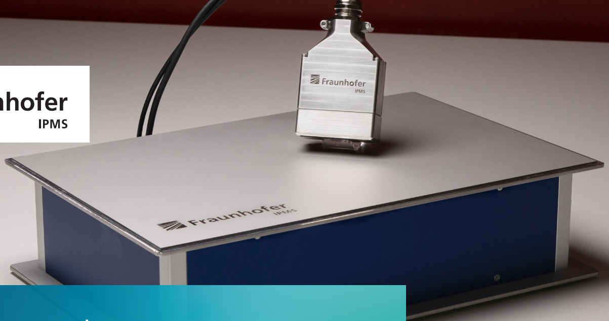
Demonstrator of Fraunhofer IPMS' ultrasound technology for medical applications